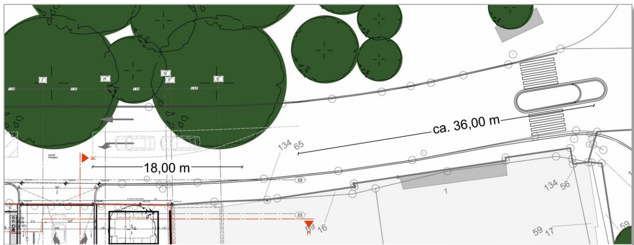
Abbildung 1: Bereich zwischen Parkdeck-Ausfahrt und Minikreisverkehr 1

nicht auf den Überweg fahren, wenn sie auf ihm warten müssten.“ Aber auch bei dieser Berücksichtigung ist die Aufstelllänge gewährleistet.