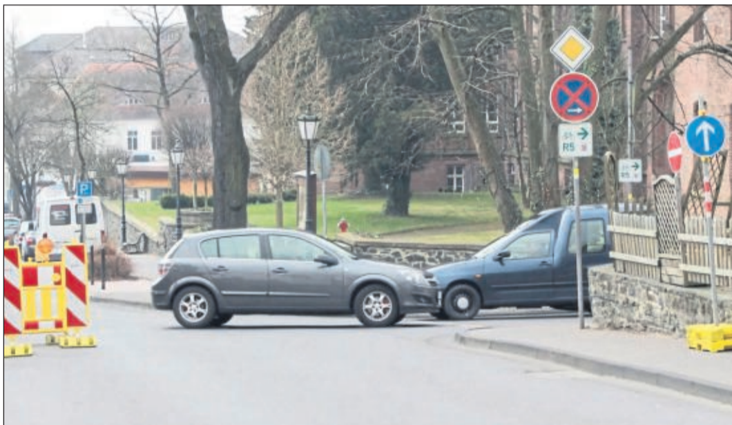
Einfahrt verboten: Der Bindeweg an der Theodor-Heuss-Schule wurde zu einer Einbahnstraße und darf von der Ziegenhainer Straße kommend nicht mehr befahren werden. Das wussten viele Autofahrer am ersten Tag noch nicht.